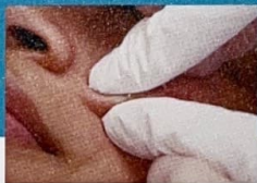
2. 毛穴の奥からクリアに